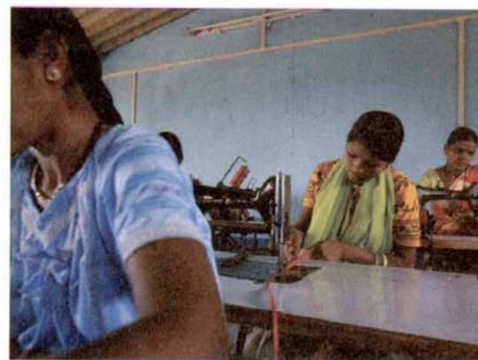
L'entreprise Creative Handicrafts, crée de nombreux emplois dans la banlieue pauvre de Bombay.