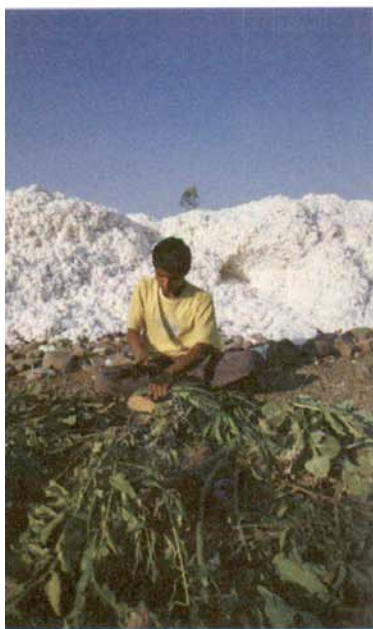
Préparation d'un pesticide à partir de plantes fermentées.

peut obtenir 200 litres de pesticides naturels à pulvériser directement dans les champs » décrit l'Indien. Certifiées bio par Ecocert et en cours de certification par la Fairtrade Labelling Organizations International (FLO), organisation internationale de labellisation du commerce équitable, ces cultures représentent donc le départ d'une filière alimentant en particulier Article 23 et Fées de Bengale, deux marques qui ont su allier éthique et chic avec succès.